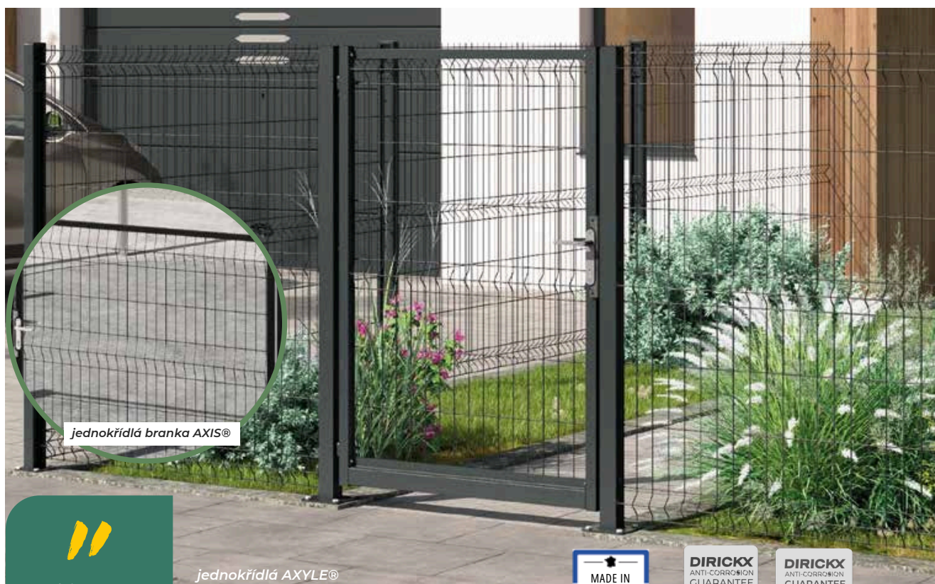
jednokřídlá branka AXIS®