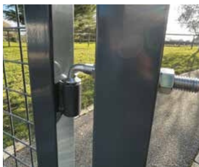
Hrnatý sloupek a rám