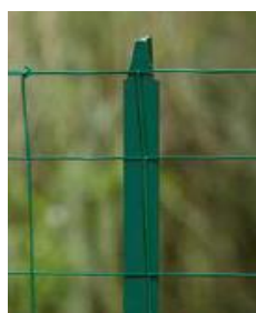
TE a T sloupek