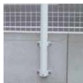
S kotevním plátem bočním