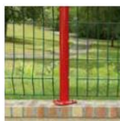
S kotevním plátem